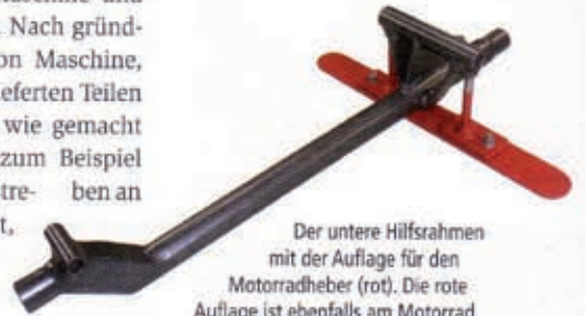
Der untere Hilfsrahmen mit der Auflage für den Motorradheber (rot). Die rote Auflage ist ebenfalls am Motorrad montiert. Darunter kann ein Wagenheber platziert werden.

Während des Umbaus bekam ich in jeder Woche einen Bericht über die Umbauten sowie Fotos der Maschine per Mail zugesandt. Schon bei der Auftragsvergabe hatten wir festgestellt, dass der Hauptständer dem Hilfsrahmen weichen musste. Peter Sauer überlegte sich sofort eine Lösung, mit der man mittels eines hydraulischen Motorradhebers das Motorrad am Hilfsrahmen anheben kann. Dazu wurden in Höhe