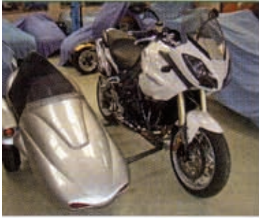
Fertig und abfahrbereit. Pünktlich zum vereinbarten Liefertermin kann ich das Gespann bei der Firma Sauer abholen.

des ehemaligen Hauptständers zwei Muttern in den Hilfsrahmen geschweißt. Hierzu gibt es zwei Einschraubfüße, mit denen sich das Motorrad auf dem Heber abstützen kann – eine durchdachte Lösung.