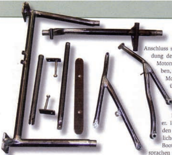
Der komplette Hilfsrahmen für Motorrad und Beiwagen vor dem Kunststoffbeschichten.

Die Telegabel hatte doch arge Mühe mit den schlechten Straßen, und alle 100 Meter eine Kurve ging damit ganz schön in die Arme. Also fiel hier die Entscheidung, die ich schon lange vor mir herschob: Die R 100 musste weg, die Triumph sollte einen wahlweise eingetragenen Beiwagen bekommen. Das würde wieder einmal so ein Gespann werden, das es nicht so einfach von der Stange zu kaufen gab, und zwar ein Schwenker.