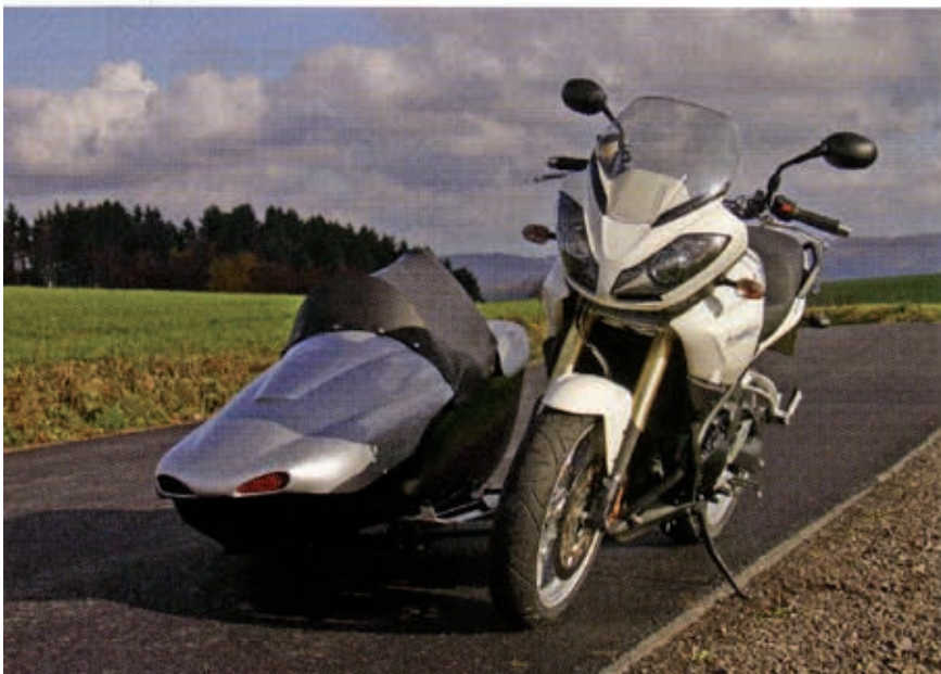
Die erste Ausfahrt mit dem neuen Gespann im Sauerland.